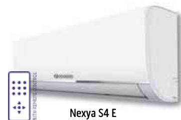
Nexya S4 E